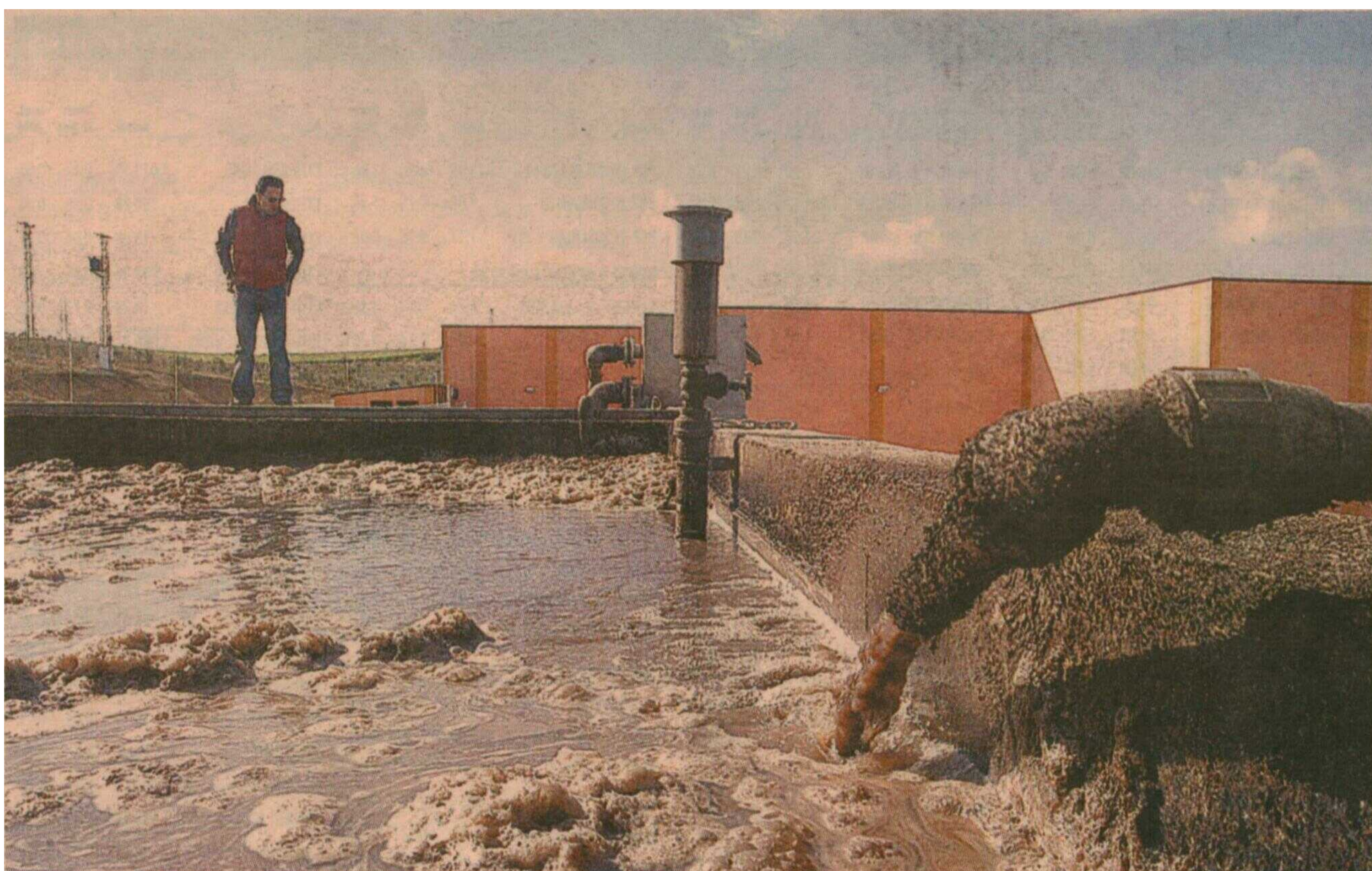
Balsa para el tratamiento del agua en una depuradora en el sur de la provincia de Valladolid.